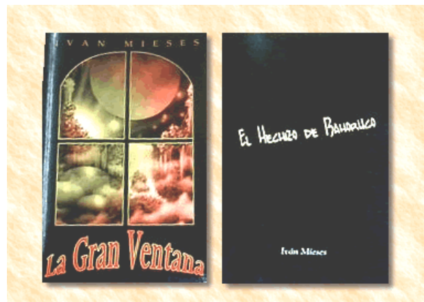
Portadas de los libros presentados por el escritor.

Escritor de novelas, cuentos, poemas, canciones y piezas instrumentales para piano; Ha sido Profesor de varias Universidades Católicas, y Actualmente es profesor de matemáticas en el estado de Nueva York.